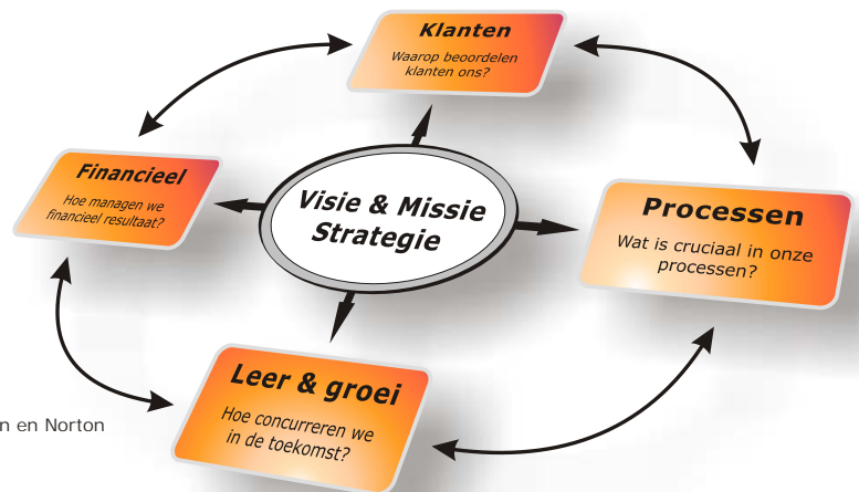
De Balanced scorecard van Kaplan en Norton

Als u meerdere stellingen met 'ja' kan beantwoorden, ziet u ongetwijfeld mogelijkheden in prestatie management binnen uw school.