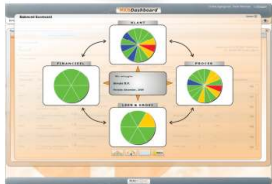
De Balanced scorecard (BSC)

Van elke ingevoerde prestatie wordt een trendanalyse bijgehouden en de prestatie wordt vergeleken met het gestelde doel.