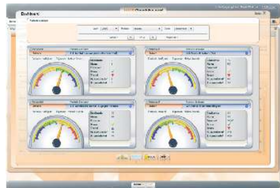
Het BeterScoren Dashboard

Totaaloverzicht van alle ingevoerde scores afgezet tegen de gestelde doelen.